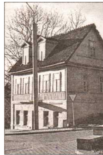
Застройка улицы Виленской и чала XX века

В этом и заключается волшебство старых кварталов. Они дают то, что не заменит ни одна четырехполосная магистраль, — покой.